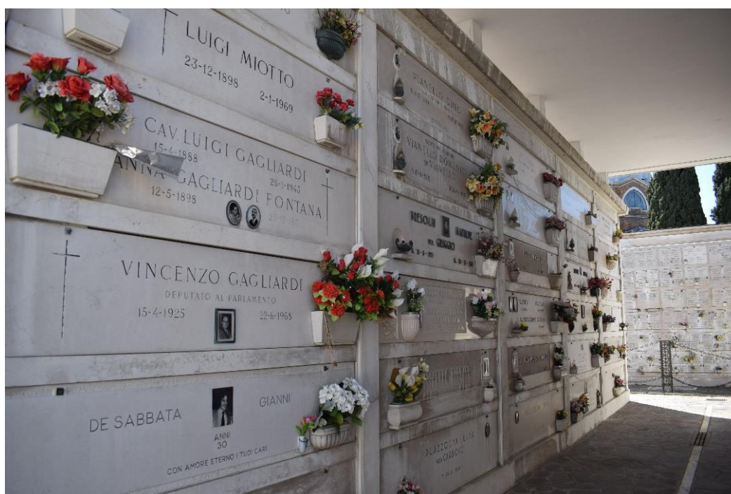
1. Uno dei primi recinti del cimitero.

Un ulteriore elemento degno di nota è sicuramente la presenza del recinto XVII, all'interno del quale troviamo il cinerario, il crematorio e la sala del commiato. La vicinanza spaziale di tutte queste zone rafforza, anche agli occhi esterni di un visitatore, l'elemento laico degli stessi. Durante la mia visita il crematorio era in funzione e la sala del commiato aperta, ma la zona che più ha attirato la mia attenzione è stata sicuramente il cinerario. Si presenta come una grande sala, illuminata dall'alto, all'interno della quale riposano insieme numerose urne cinerarie databili dal 19° secolo ai giorni nostri. Il carattere storico è innegabile, in quanto testimonia la radicata storia di una pratica come quella della cremazione, ma lo è anche quello estetico: molte urne sono elaborate e finemente decorate, rappresentanti di un'arte funeraria forse non abbastanza studiata nel contesto italiano.