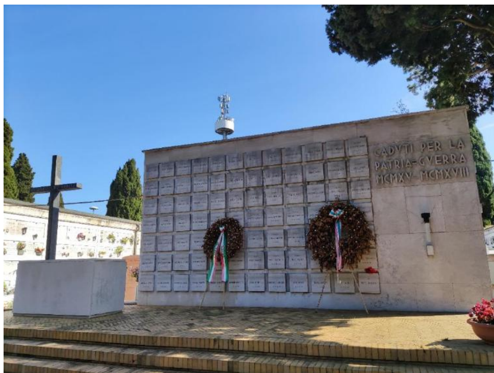
12. Altare della Patria.