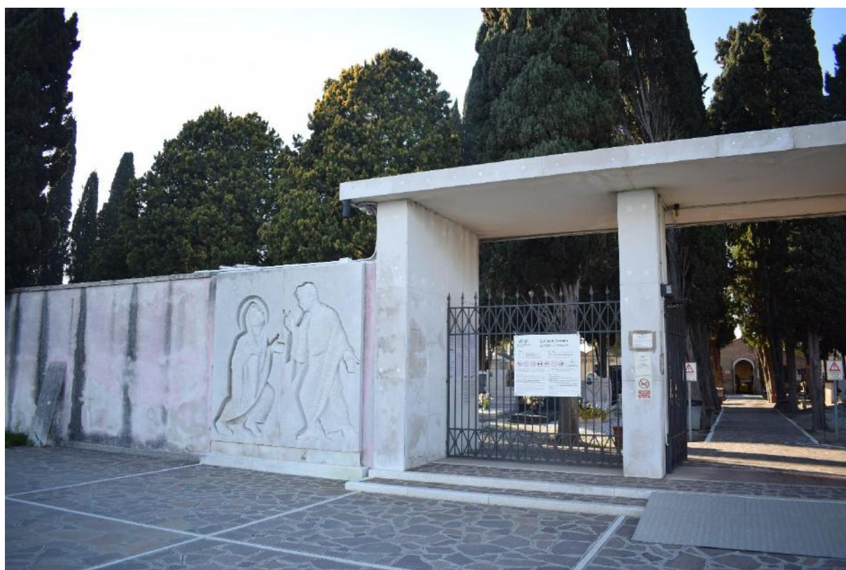
7. Ingresso al cimitero di Burano. Fotografia di Irene Renzi scattata durante la ricerca sul campo.

moderno dell'ingresso. Accanto al cimitero, inoltre, è ad oggi situato un campo da calcio. Mentre stavo camminando verso il camposanto potevo sentire le urla e gli schiamazzi allegri di bambini intenti in una partitella o in un allenamento e non ho potuto fare a meno di notare il contrasto tra le due cose. In questi casi ritengo che la liminalità del cimitero venga ancor più accentuata, così a stretto contatto con il mondo dei vivi senza tuttavia entrarvi in relazione e continuando a mantenere, piuttosto, la propria identità.