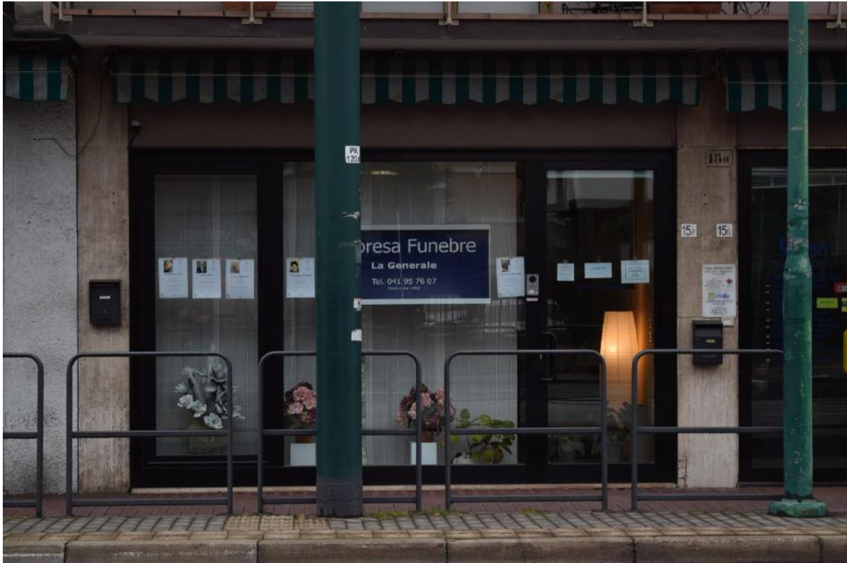
15. Esterno dell'Impresa di Onoranze Funebri La Generale. Fotografia di Irene Renzi, scattata durante la ricerca sul campo.