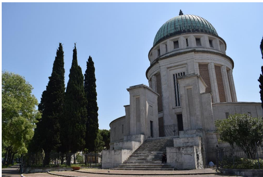
9. Tempio Votivo della Pace.

muro una lapide uguale fornisce la stessa esperienza: si tratta della tomba congiunta dei coniugi Friedenbergs (Mario ed Egle Manara), lui di religione ebraica e lei di religione cattolica. Nonostante la diversa appartenenza religiosa il loro legame è rimasto saldo e ha creato un'apertura tra i due cimiteri, portando in un certo senso a un maggiore senso di continuità dello spazio.