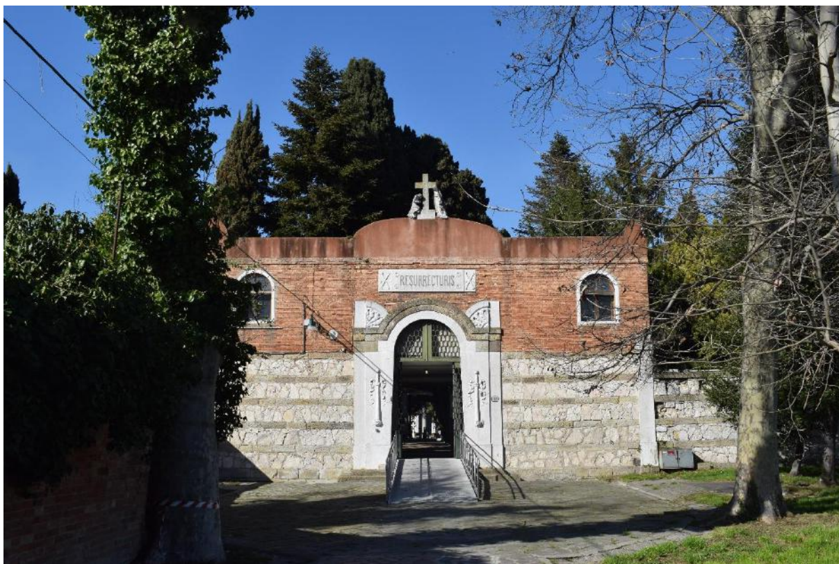
6. Ingresso al cimitero di Murano.

Gli altri cimiteri delle isole veneziane sono realtà più piccole e più locali, ben lontane dalla maestosità e dalla popolarità del cimitero di San Michele. Il cimitero di Murano colpisce per la propria posizione isolata e tranquilla, ai margini dell'isola e in fondo a un viale alberato che sembra preparare il visitatore all'ingresso. In alto, sull'entrata, si è accolti dall'espressione latina Resurrecturis (sarà resuscitato) e all'interno lo spazio si presenta come circoscritto e separato in due zone principali. Troviamo, inoltre, una sezione dedicata ai caduti della Prima guerra mondiale e, vicino all'ingresso, la parte riservata alle sepolture di religiosi.