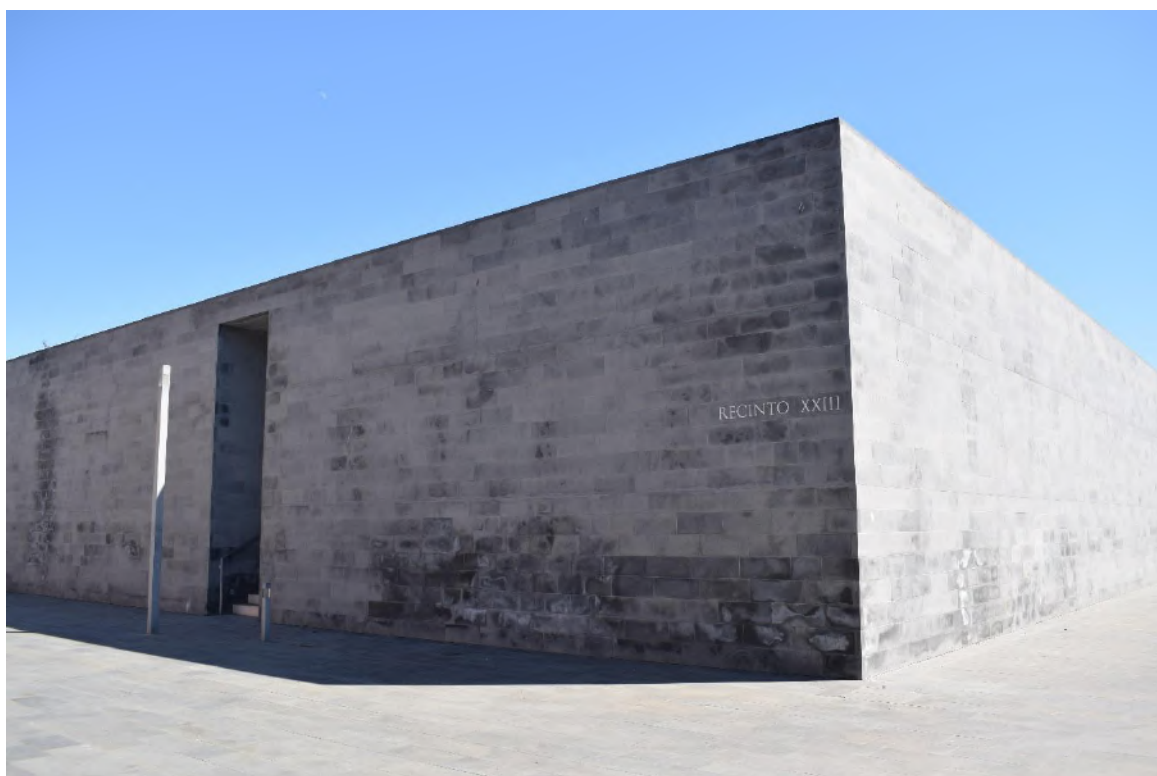
3. Una delle nuove aree progettate dall'architetto David Chipperfield. Fotografia di Irene Renzi scattata durante la ricerca sul campo.