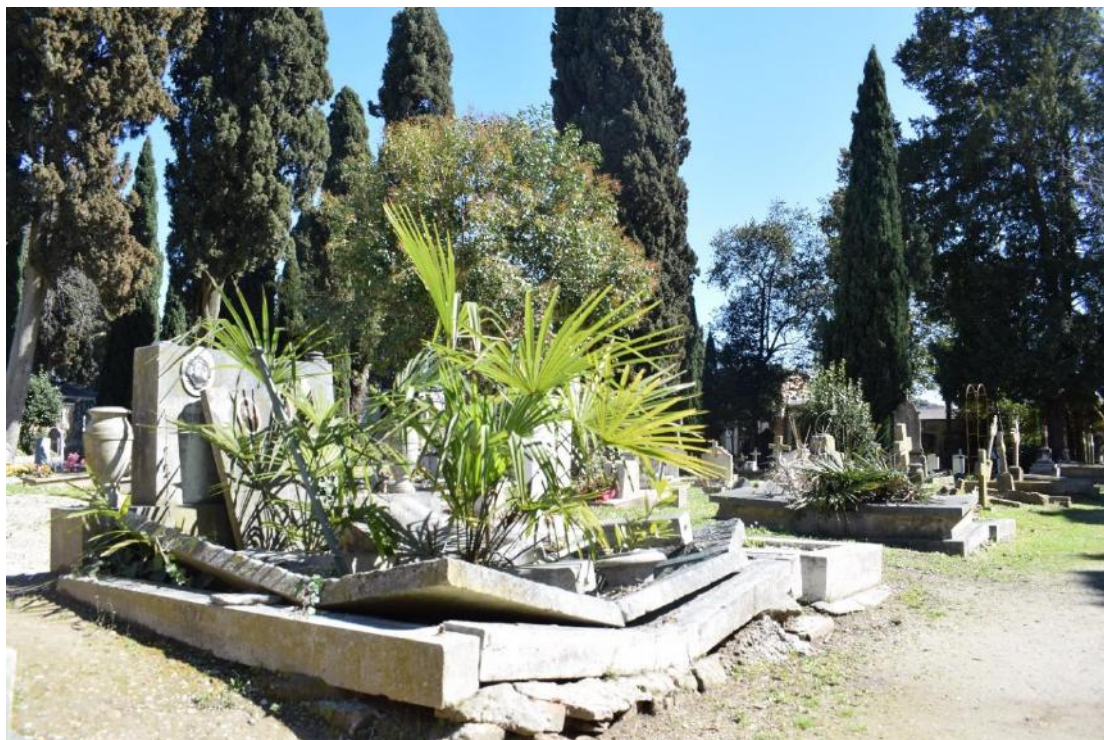
2. Scorcio del recinto protestante. Fotografia di Irene Renzi scattata durante la ricerca sul campo.