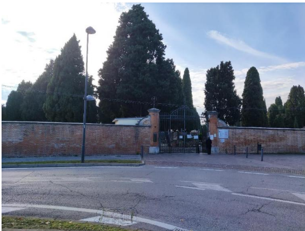
11. Uno degli ingressi al cimitero di Mestre.

Michele), mentre sulla terraferma lo spazio è maggiore e, perciò, non presentano gli stessi problemi.