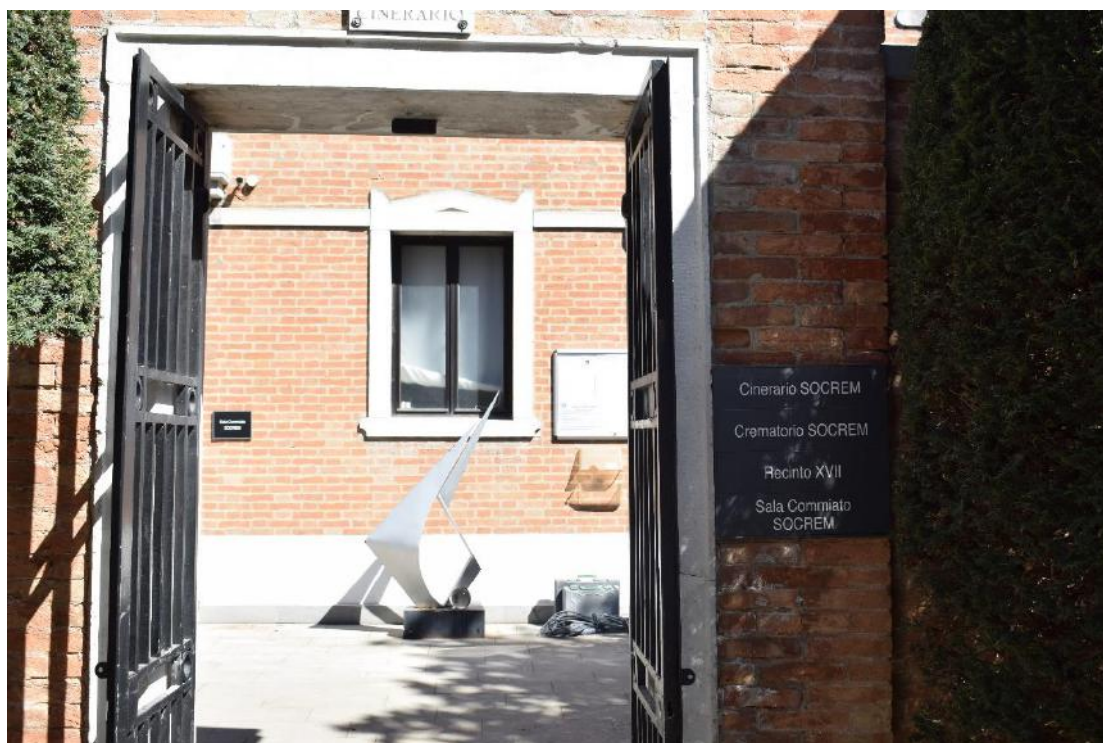
5. Esterno del recinto XVII.