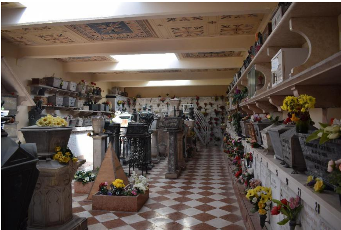
4. Cinerario del recinto XVII.