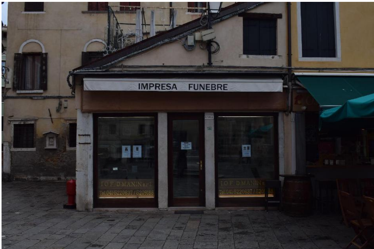
14. Esterno dell'Impresa Funebre Manin.