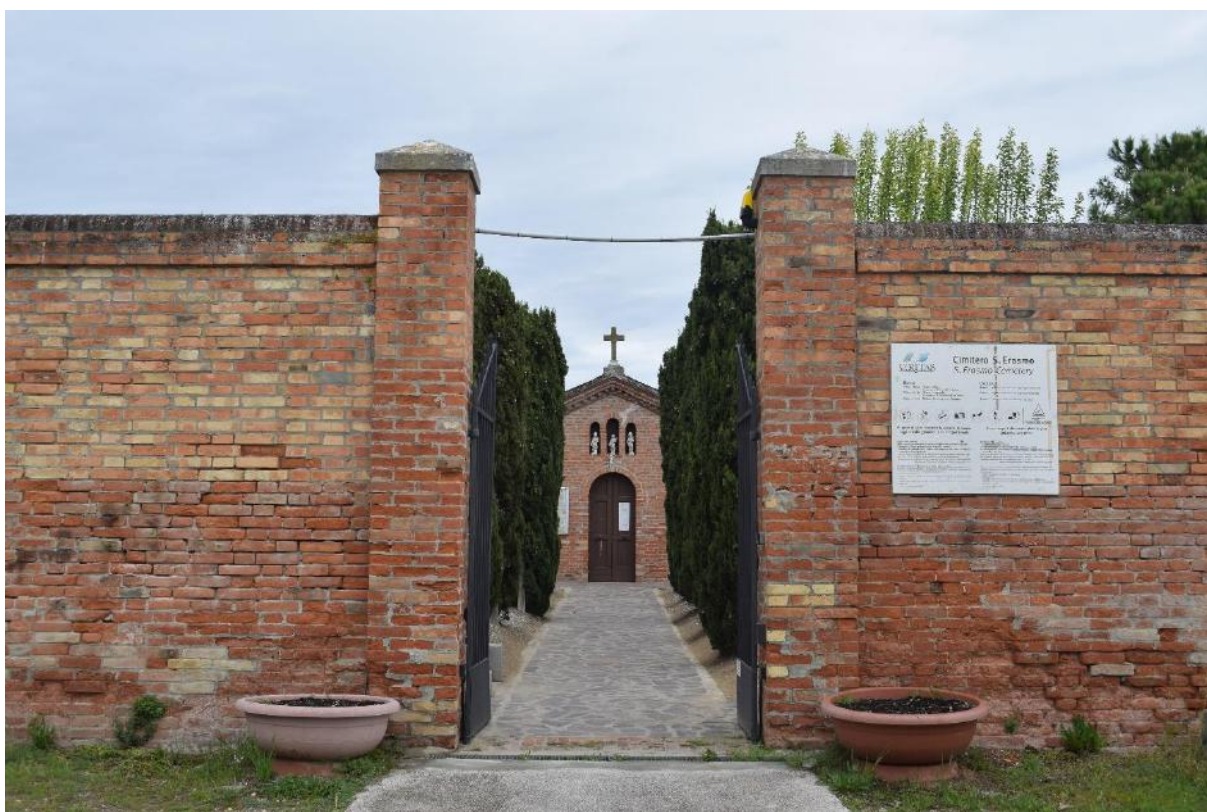
8. Ingresso al cimitero di Sant'Erasmus.

a una donna che stava con ogni probabilità tornando indietro proprio dal cimitero per dirigersi verso il centro dell'isola, dove è situata anche la chiesa di Cristo Re. Sembrava quasi confusa dalla domanda e ciò non stupisce: il cimitero di Sant'Erasmus, piccolo e quasi "nascosto", è un po' l'antitesi rispetto a quello di San Michele e dubito abbia mai conosciuto numerosi visitatori all'infuori di chi vi si reca per andare a trovare una persona cara.