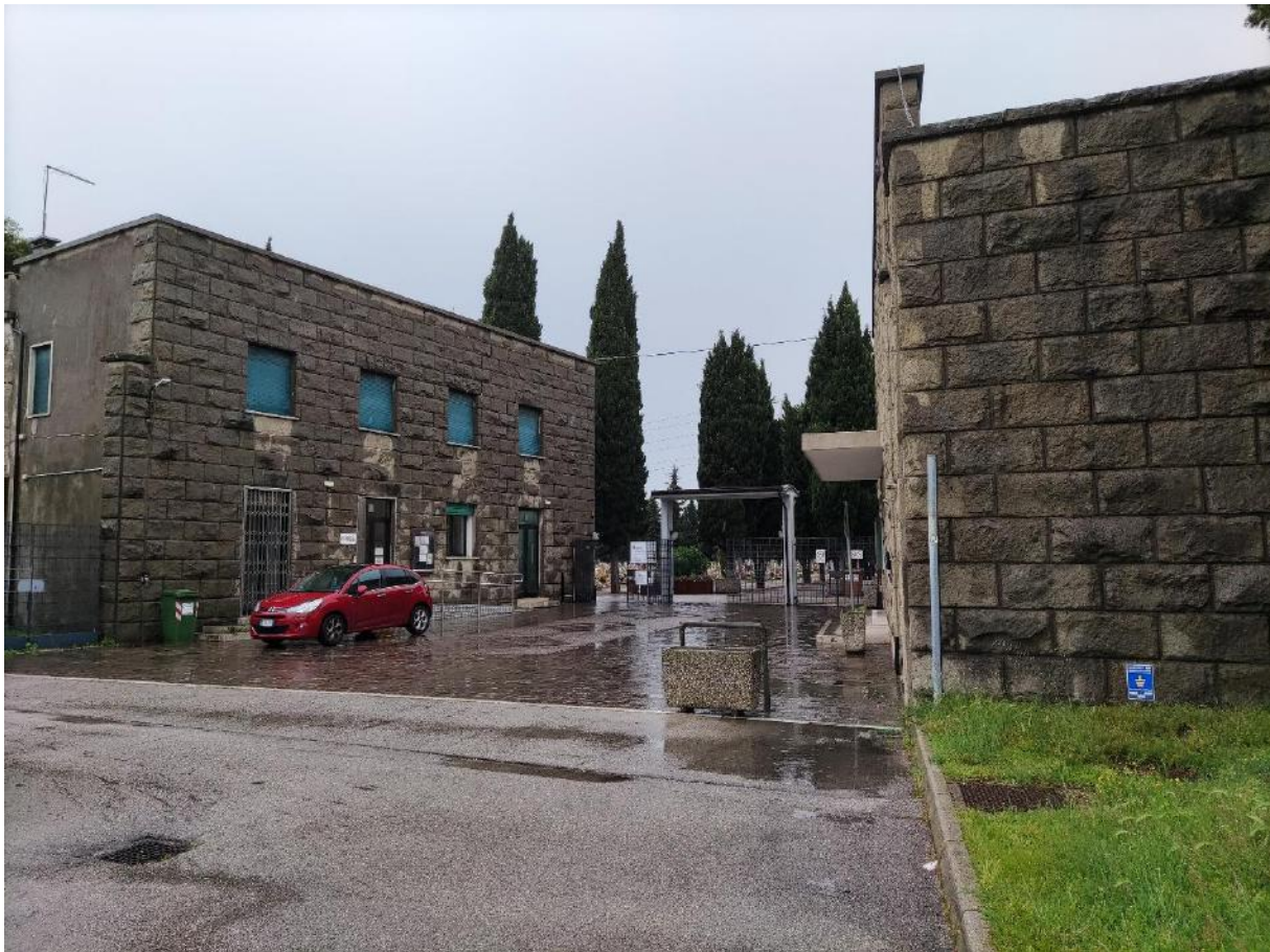
13. Ingresso al cimitero di Marghera.

I cimiteri veneziani si presentano sì come luoghi progettati per ospitare i defunti, ma visitarli rende chiaro che essi non siano affatto degli spazi “morti”. All’interno di essi, così come i defunti hanno il proprio ruolo, anche i vivi ne assumono uno ben preciso. Visitatori e turisti vi passeggiano all’interno accompagnati da rappresentanti della fauna locale (il cimitero di Mestre ospita una notevole colonia di scoiattoli) e da specialisti e lavoratori “di passaggio”, a conferma della liminalità del luogo, ma comunque forti del proprio legame con esso. Per quanto riguarda le figure lavorative, ambienti del genere ne ospitano di molti tipi: dai guardiani, ai giardinieri, agli operai e agli addetti ai crematori. Nei prossimi due capitoli andrò a indagare nel dettaglio cosa