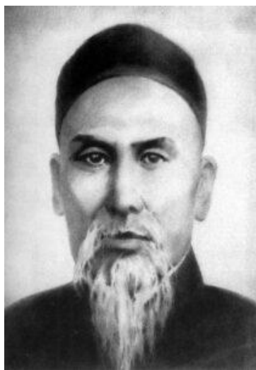
Fig. 7 - Yang Luchan

L'apporto di Chen Changxin sarebbe importante anche per un altro motivo: Chen Changxing è stato l'insegnante di Yang Luchan (1799-1872).