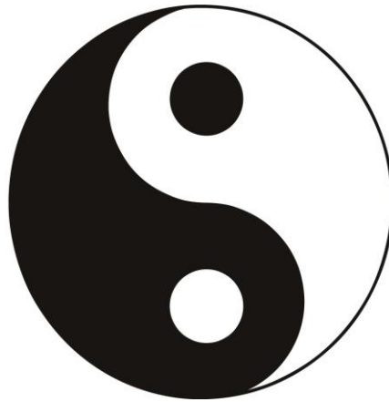
Fig. 3 - Diagramma di Taiji

Pertanto non è solo un'arte marziale di autodifesa, quanto una disciplina spirituale, una "meditazione in movimento", che coinvolge l'individuo a tutti i livelli e richiede lunghi anni di pratica.