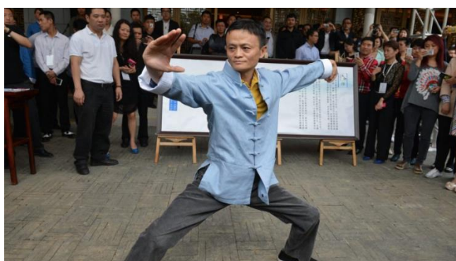
Fig. 8 - Jack Ma che pratica Taiji quan

Secondo Wang Yu e Ren Xiaojin 59 , Jack Ma è la figura più attiva nel professare i benefici del Taiji quan in ambito aziendale. Dopo averlo praticato per più di tre decenni, Ma lo ha reso parte integrante della cultura organizzativa di Alibaba. Le persone che vengono assunte nella sua azienda devono partecipare a dei laboratori di Taiji quan come parte del loro percorso di formazione. Jack Ma ha affermato che la filosofia del bilanciamento delle energie interiori, alla base del Taiji quan , è paragonabile alla gestione di un’azienda. Sostiene anche di aver sviluppato abilità di comando grazie al Taoismo, capacità amministrative dal Confucianesimo e l’ispirazione per vivere una vita normale, priva di fronzoli, dal Buddismo. Citando le sue parole: “Il Taiji quan è ciò che combina tutte queste componenti insieme 60 ”.