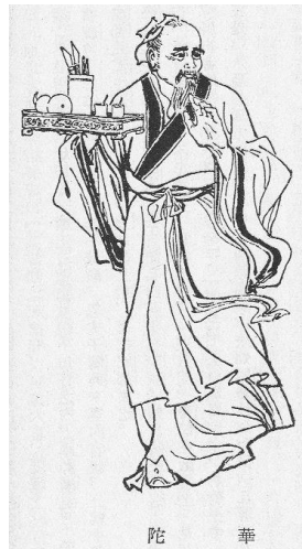
Fig. 5 - Hua Tuo

ideati per mantenere e migliorare la salute delle persone. Si contrappone all'applicazione di altre tecniche finalizzate alla cura dei malati, come il Qi gong .