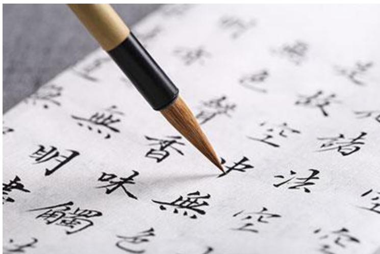
Fig. 1 – Caratteri cinesi

Agli inizi del Novecento, in seguito alla caduta dell'Impero e alla nascita della Repubblica Cinese, ha avuto inizio un dibattito piuttosto acceso sulla lingua cinese e, soprattutto, sulla necessità di una lingua accessibile a tutti. Fu così che cominciò un processo di trasformazione della lingua cinese. Prendendo spunto dalla pronuncia del dialetto mandarino parlato a Pechino, venne creata una prima versione provvisoria di cinese standard, chiamata all'inizio 国语 ( guoyu , che significa "lingua nazionale" 6 ) e poi putonghua , il nome utilizzato ancora oggi. Questa nuova lingua franca venne ufficializzata come la forma standard della Repubblica di Cina nel 1932 e venne mantenuta anche successivamente alla nascita dell'odierna Repubblica Popolare Cinese nel 1949.