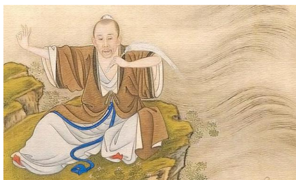
Fig. 6 - Zhang San Feng

Uno nacque nella dinastia Song (960-1279 d.C.), visse sulla Montagna Wudang come recluso e combinò le tredici posture con altre pratiche e arti taoiste per creare uno stile di arti marziali interne che divenne popolare tra i taoisti che vivevano e studiavano sulla Montagna Wudang . Il secondo maestro Zhang San Feng (1279-1368) era originario di Yizhou , nella provincia di Liaotung. Il suo nome da studioso era Chuan Yee e Chun Shee. Anche lui viveva sul monte Wudang ed era un maestro e studioso taoista molto apprezzato, con molti poteri magici, divinatori e di guarigione. Visse molto a lungo e fu assai popolare tra la popolazione locale.