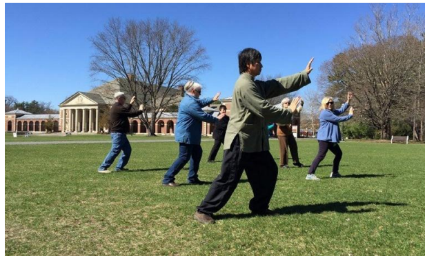
Fig. 2 - Persone che fanno Taiji quan nei parchi pubblici

Ci sono molte pubblicazioni in prestigiose riviste scientifiche che attestano l'utilità del Taiji quan per la salute delle persone. Ad esempio, Chenchen Wang in un suo articolo del 2010 afferma che questa disciplina può aiutare a contrastare stress, ansia e depressione. Il Taiji quan come esercizio fisico permette di ottenere anche altri benefici, come il miglioramento della postura, la prevenzione delle cadute accidentali e un maggiore tono muscolare.