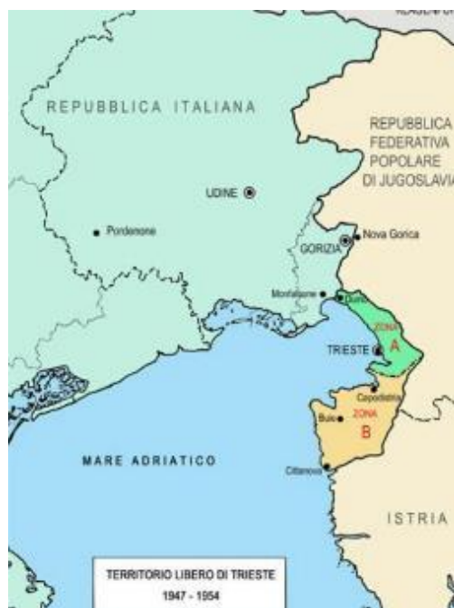
Figura 1. I confini del Territorio Libero di Trieste nel 1947. La zona sotto il controllo alleato, la zona B sotto il controllo jugoslavo.

L’idea di istituire il TLT fu pensata anche per cercare di evitare uno scontro tra Italia e Jugoslavia, poiché la Jugoslavia aveva manifestato più volte la propria insoddisfazione riguardo le definizioni territoriali. Per gli anglo-americani Trieste era un posto strategico da preservare come ultimo baluardo politico della democrazia occidentale prima dell’URSS, di cui la Jugoslavia era emanazione. Un’importanza strategica enorme che volevano controllare di propria mano per tutelare attraverso una frontiera sicura gli interessi occidentali dalla minaccia di un blocco sovietico ad oriente.